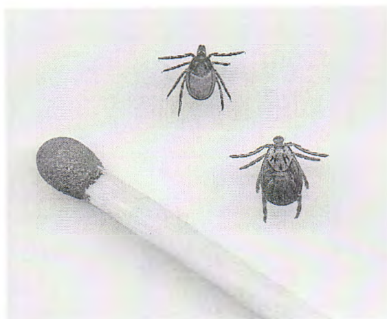
Рис. 3. Сравнительные размеры клещей (выше и левее расположена самка рода Иксодес, ниже и правее — самка рода Дермацентор)