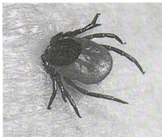
Рис. 4. Самка рода Иксодес, присосавшаяся к коже человека