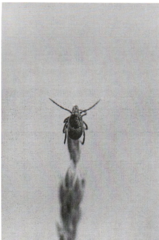
Рис. 1. Таежный клещ на травинке в позе ожидания

дельную емкость, подписав фамилию пострадавшего. Клещей доставить в лабораторию как можно скорее для выполнения исследования.